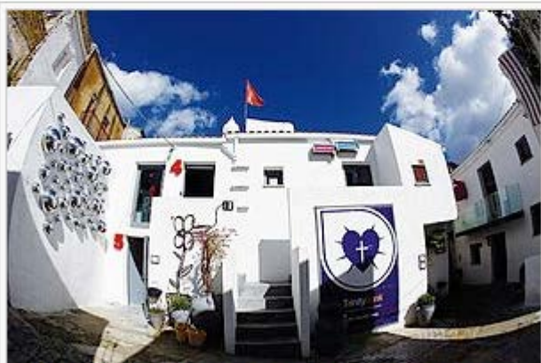
Sede mapping Party - Park Cultural Farm Cortile Bentivegna di Favara