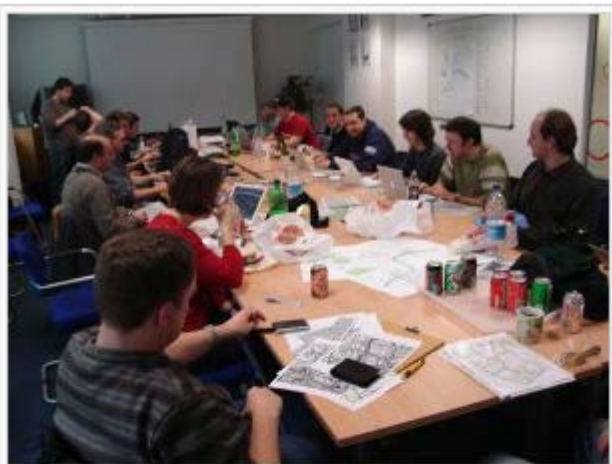
London mapping party