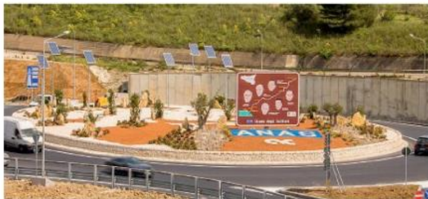
La rotonda della “Strada degli Scrittori”