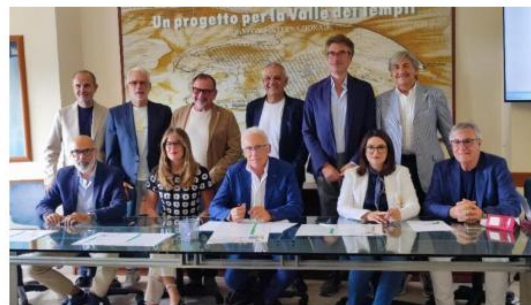
Un momento della presentazione del convegno

L’iniziativa è patrocinata dall’Umar (Unione architetti del Mediterraneo), dal Consiglio nazionale degli architetti, dall’Arcidiocesi di Agrigento, dal Parco Valle dei Templi, dalla Consulta regionale degli Ordini degli architetti, dalla Fondazione Agrigento 2025, dal Polo universitario di Agrigento, dal Libero Consorzio Comunale e dal Comune di Agrigento