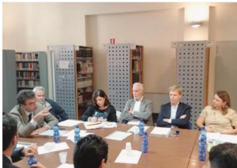
LA RIUNIONE SULLA CONCERTAZIONE PER LA REVISIONE DEL PIANO REGOLATORE

Spazio sarà dato anche alla fascia costiera, nello specifico per viale delle Dune