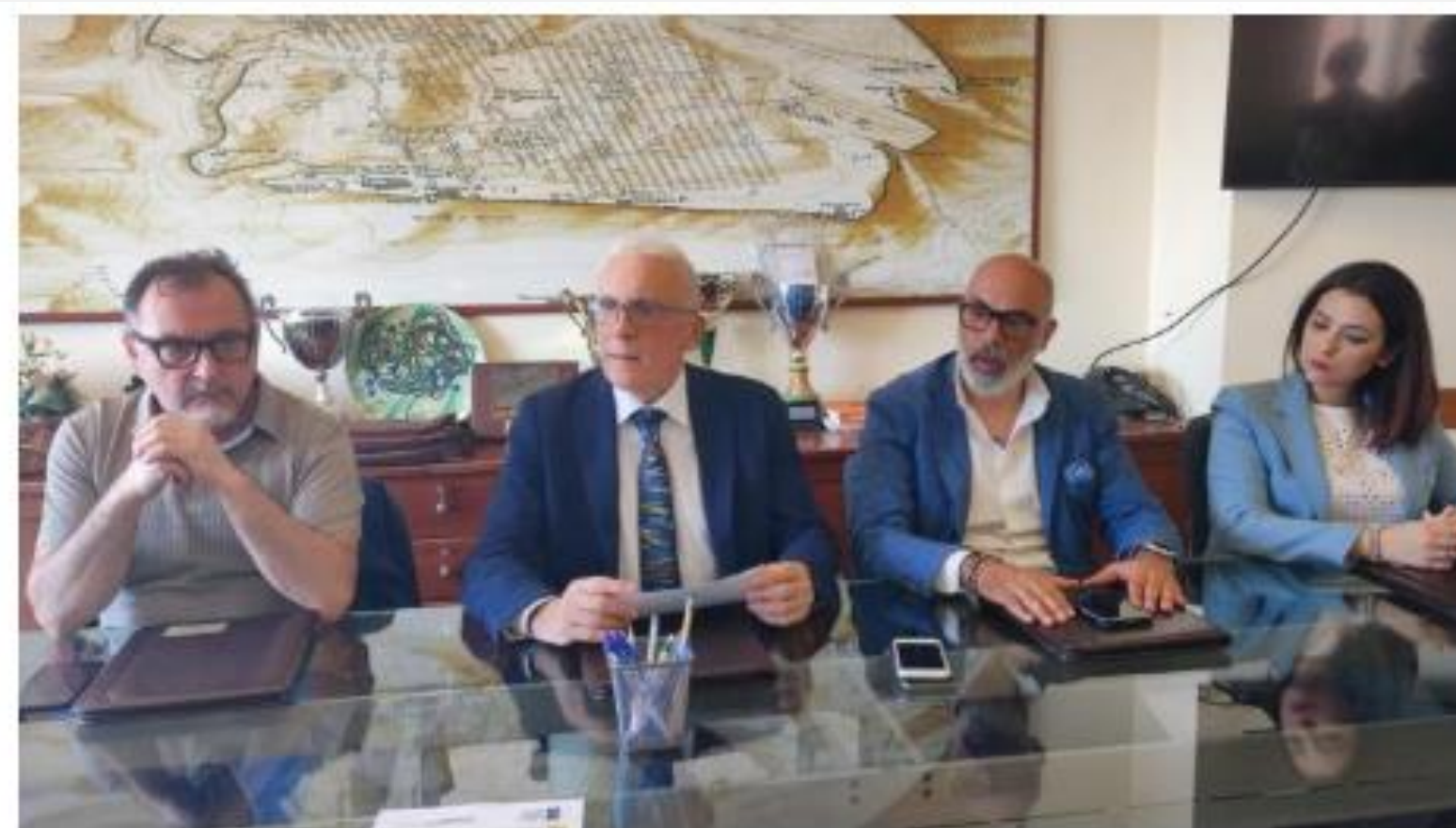
Un momento della conferenza stampa

Il Premio è stato istituito dall’Ordine degli Architetti con il Consiglio nazionale degli architetti e la Fondazione Architetti nel Mediterraneo, con il patrocinio di: Arcidiocesi di Agrigento, rivista Chiesa Oggi, Comune di Agrigento, Fondazione Agrigento Capitale italiana della Cultura, Parco Valle dei Templi, Università degli Studi di Palermo, Unione architetti nel Mediterraneo (Umar), Consulta regionale degli Architetti e Polo universitario di Agrigento.