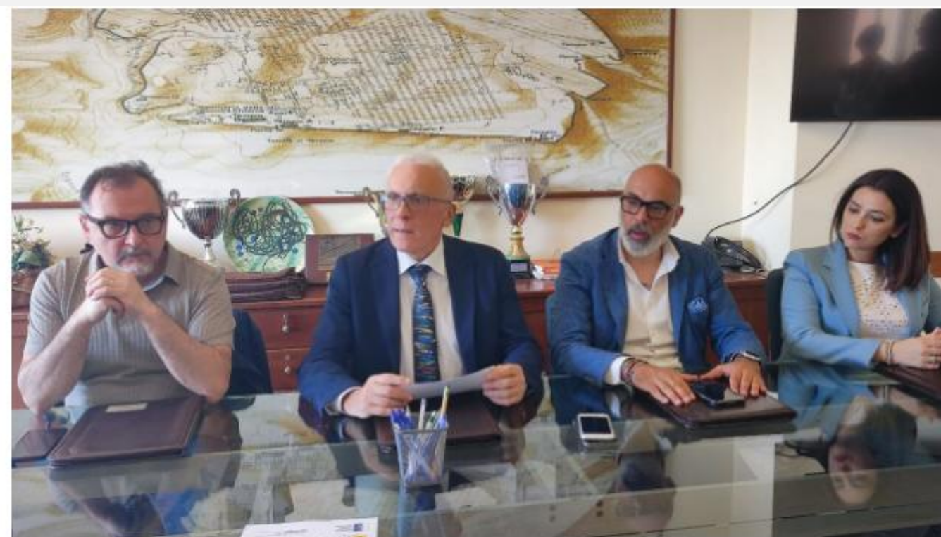
Un momento della presentazione del premio