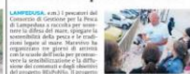
LAMPEDUSA. (c.a.) I pescatori del Comune di Gela per la Pesca di Lampedusa a scuola per sensibilizzare i ragazzi sul tema dell'ambiente. Il progetto è stato organizzato dal Comune di Gela in collaborazione con il Comune di Lampedusa. I ragazzi hanno partecipato a una giornata di pulizia della spiaggia e hanno raccolto rifiuti. Il progetto è stato organizzato dal Comune di Gela in collaborazione con il Comune di Lampedusa. I ragazzi hanno partecipato a una giornata di pulizia della spiaggia e hanno raccolto rifiuti. Il progetto è stato organizzato dal Comune di Gela in collaborazione con il Comune di Lampedusa. I ragazzi hanno partecipato a una giornata di pulizia della spiaggia e hanno raccolto rifiuti.