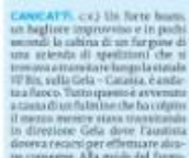
CANICATTI. (c.a.) Un forte fuoco ha bruciato un furgone e il conducente è stato ferito. Il conducente è stato trasportato in ospedale e si trova in buone condizioni. Il furgone è stato distrutto dalle fiamme. Il conducente è stato trasportato in ospedale e si trova in buone condizioni. Il furgone è stato distrutto dalle fiamme.

in data 6 novembre dopo che la Soprintendenza aveva trovato una prima nota di comune premissa con parere negativo. Ed allora, Canicatti non può avere lo stadio in condizioni da far giocare la propria squadra del cuore in città oppure no? Un interrogativo che in questi giorni, il progetto in cantiere si ripropone con il decreto del comune di Canicatti. Una attesa che dura ormai da un anno e mezzo.