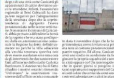
CANICATTI. Per avere uno stadio degno di una città come Canicatti gli appalti di calcio dovranno ancora attendere. Infatti, l'assessorato regionale ai Beni Culturali ha dato parere negativo per l'adeguamento della struttura dopo che la soprintendenza di Agrigento aveva già autorizzato la demolizione della vecchia struttura sportiva non deve essere demolita ma restaurata

CANICATTI. Parere negativo dell'assessorato Beni Culturali per l'adeguamento